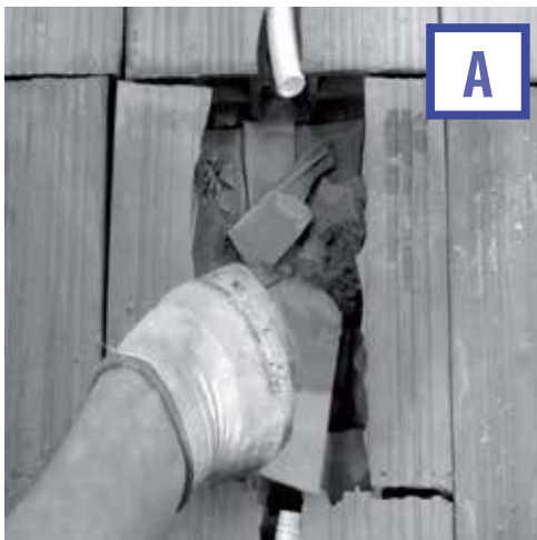
А. ПОДГОТОВЬТЕ ОТВЕРСТИЕ И ПОДВЕДИТЕ ДРЕНАЖНЫЕ КОММУНИКАЦИИ