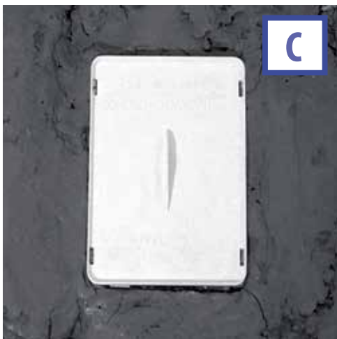
С. ЗАКРОЙТЕ СИФОН ЗАЩИТНОЙ КРЫШКОЙ. ПОДГОТОВЬТЕ ПОВЕРХНОСТЬ ВОКРУГ СИФОНА